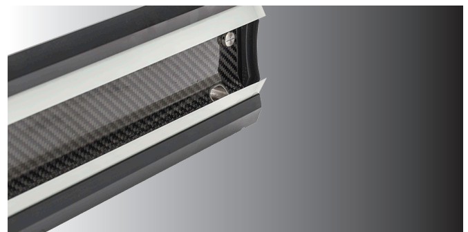
Boquillas laterales integradas