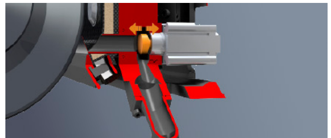
Función de vaciado rápido